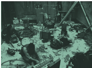
Hans Roels Street Music

Artistieke leiding Hans Roels • Artistieke ondersteuning Jasper Vanpaemel Uitvoerders Creatief Atelier van het SLAC/Conservatorium, Collectief Publiek Geluid • Technische ondersteuning PCT Dommelhof • I.s.m. C-TAKT, Musica, Impulscentrum voor Muziek